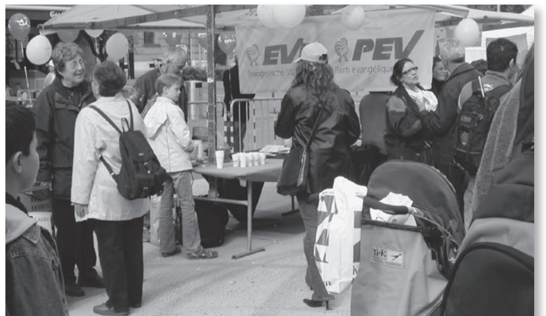
EVP-Stand in Bern anlässlich des grossen Festes für faire Kinderzulagen.